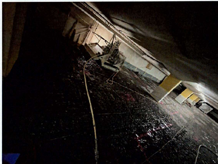
Horizontaler Abtrag des Hartbetons.