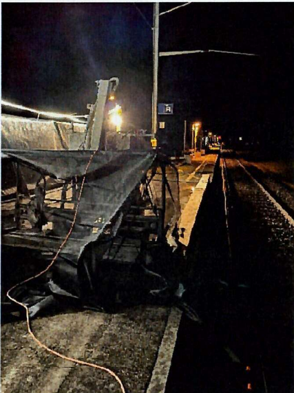
Roboter beim Arbeitsbereich