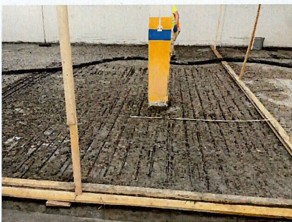
Betonabtrag bis auf die Armierung

Bei diesem Objekt haben wir den Hartbeton im gesamten Parkhaus in vier Etappen abgetragen. Dabei haben wir nicht nur den Abtrag gemeistert, wir waren auch für das zusammenräumen des angefallenen Materials mit unserem Bobcat und der gesamten Neutralisation verantwortlich.