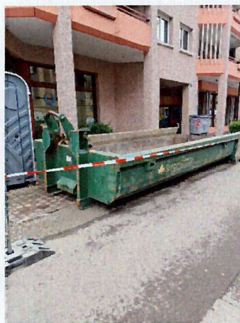
Mulde für Betonabtrag