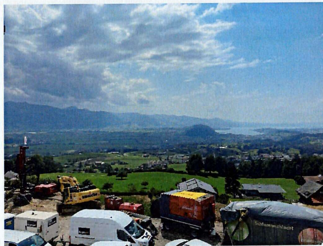
Aussicht vom Arbeitsbereich mit Fuhrpark