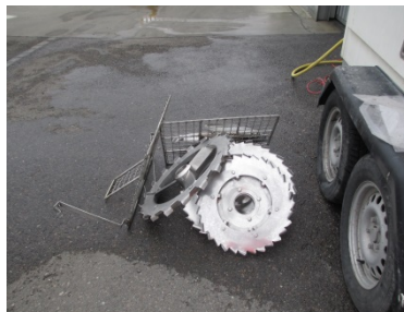
Auch Kleinteile werden fein sauber